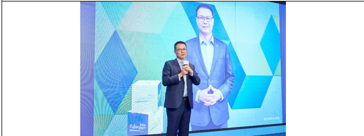
相片二：簡報會即場展示利用人工智能技術生成的數碼港行政總裁鄭松岩博士影片。